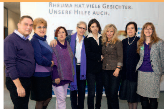
Willkommener Besuch: Die Delegation der ORS mit Mitgliedern des Vorstands und Geschäftsführung der Deutschen Rheuma-Liga NRW