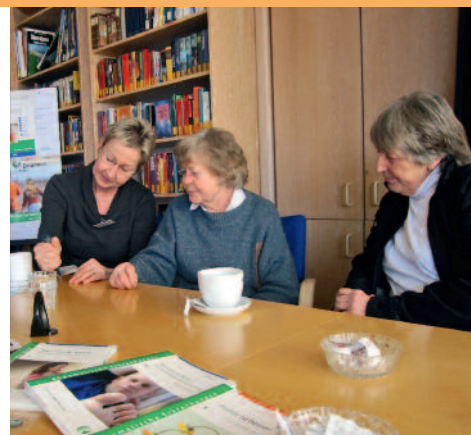
Hat sich etabliert: Die Beratung im Rheuma-Café Bonn

Da die Ehrenamtlichen der Deutschen Rheuma-Liga NRW in der Regel selbst von einer rheumatischen Erkrankung betroffen sind, kennen sie die Situation der Patienten nach der Diagnose aus eigenem Erleben und wissen, welche Informationen nun für die Patienten wichtig sind. Sie bieten in dieser Situation Rat und Hilfe, stellen die Unterstützungsangebote der Deut-